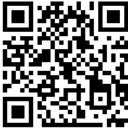
QR Code เอกสารแนบท้ายสัญญา ผนวก 1-3